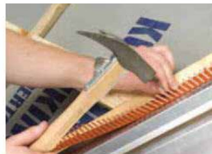
Fuglegitteret fastgøres med vejrbestandige papsøm pr. 25 cm.