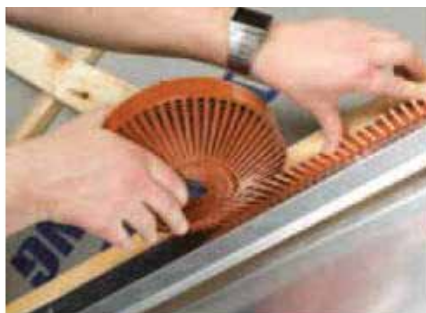
Fuglegitteret placeres på blindfalsen med gitterne ud mod skotrende.